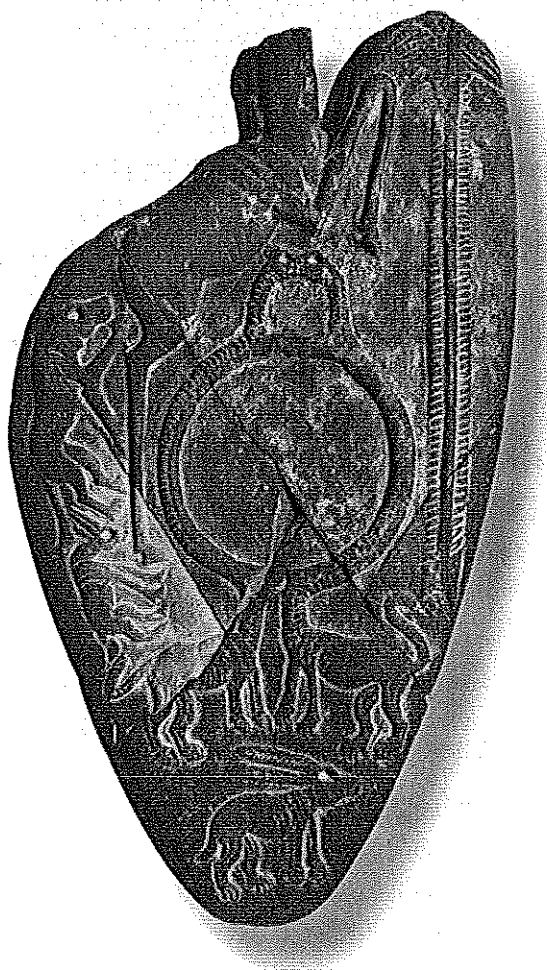
Figure 1 : palette de Minshat Ezzat.

D'ores et déjà, le cimetière protodynastique de Minshat Ezzat apparaît comme l'un des plus importants quant aux dimensions des tombes, à la qualité et à la variété des objets. Il s'affirme comme un apport essentiel pour les connaissances de cette période fondamentale de l'émergence du pouvoir pharaonique en Egypte.