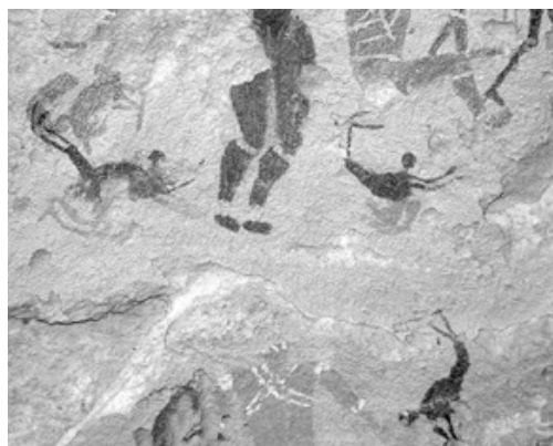
Fig. 2 Détail des nageurs du même site et, en bas à droite, un « plongeur » [Du Sahara au Nil : fig. 435]

interprétation de la distorsion des corps vus sous l'eau. Quelle curiosité de voir des images de nageurs au cœur du désert de Libye, à un endroit où aujourd'hui, à plusieurs centaines de kilomètres à la ronde, il n'y a même pas d'eau ! » (Almásy 1936 : 79). Comme il s'intéressait aux traditions occultes, il imagina que les « nageurs » peints dans cette cavité avaient pu être liés à quelque rituel destiné à se concilier les faveurs des esprits aquatiques, du temps où le désert commençait à s'assécher dangereusement (Kelly 2002 : 104).