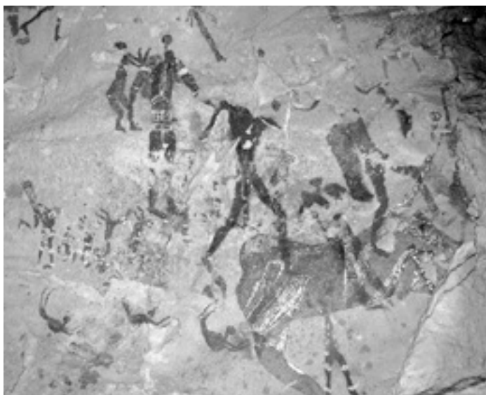
Fig. 1 Wadi Sora : détail de la paroi de la Grotte des Nageurs découverte par Laszlo de Almásy. Une file desdits nageurs se dirige vers la « bête » mythique, que le premier d'entre eux vient toucher [Du Sahara au Nil : fig. 430]

Au moment de la découverte, Almásy fut extrêmement surpris par la série des petits personnages donnant l'impression d'être en train de nager : « Je fus impressionné, écrivit-il, par une fresque représentant des nageurs, dont le dessin donne une excellente