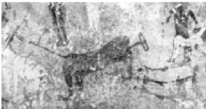
Fig. 5 Grotte des bêtes : celle-ci, entourée de nombreux personnages dont la plupart sont réduits à un signe cruciforme, dévore un individu qui porte ses mains à la tête, dans un geste qui rappelle les textes funéraires égyptiens évoquant « les noyés dont les bras sont à hauteur du visage » [Du Sahara au Nil : fig. 710]