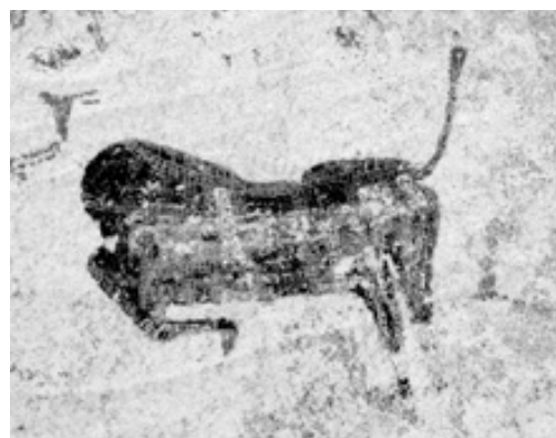
Fig. 7 Cette « bête » du Wadi Sora fait partie de celles qui sont prises dans des rets souvent difficiles à distinguer, car peints en jaune ou en blanc, couleurs fragiles qui disparaissent généralement en premier [Du Sahara au Nil : fig. 711]

Tout cela pourrait fort bien s'appliquer aux images de notre Bête en tournée de nageurs, mais l'on aimerait bien avoir quelque indice susceptible de renforcer cette présomption. Or, huit des Bêtes actuellement connues (soit plus d'une sur quatre) semblent enveloppées dans des sortes de rets, dont le quadrillage est nettement dessiné en blanc ou surtout en jaune ; certains des nageurs ayant le corps rayé de ces mêmes traits jaunes (fig. 7). On se souvient alors que plusieurs passages du livre des Morts mentionnent des divinités cynocéphales qui, dans l'autre monde, pêchent au filet les esprits mauvais, les compagnons de Seth et les âmes des méchants. Fatigués, chavirés, en état de langueur, les nageurs peinent aussi à éviter le filet des « pêcheurs de