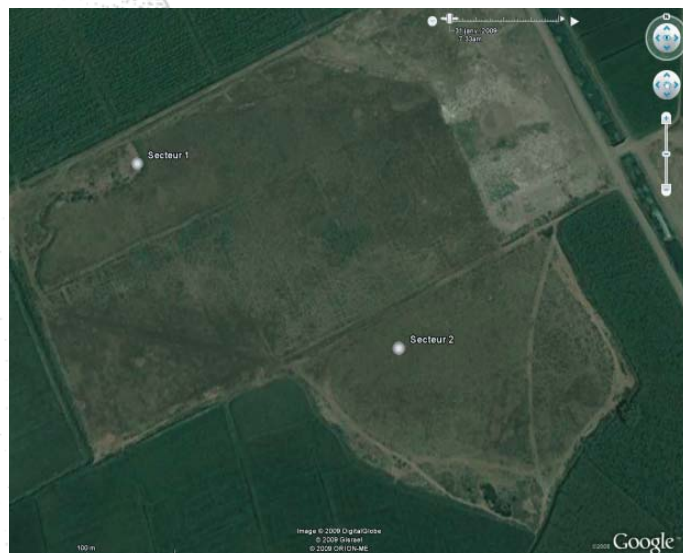
Fig. 2 - Vue Google Earth du site de Tell el-Isxid

Nous avons effectué en 2006 une reconnaissance du site, accompagnée de sondages à la tarière (fig. 4), et nous avons entrepris depuis 2007 le premier volet d'un programme de fouille qui doit prendre fin en 2010. Un premier bilan sera alors dressé et, si tous les dieux de l'Égypte sont avec nous, un second programme quadriennal entrepris. C'est ainsi que marche la science aujourd'hui.