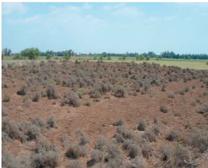
Fig. 3 - Vue générale de Tell el-Iswid