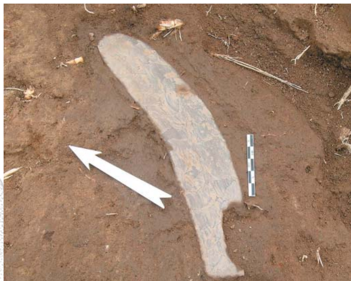
Fig. 9 - Couteau bifacial découvert sur le secteur 1

Les premières études de matériel ( fig. 9 ), notamment céramiques, confirment les 3 grandes périodes chronologiques décelées et soulignent la forte représentation de la phase protodynastique (Nagada IIIC-D-3ème dynastie). La présence de la culture prédynastique de Basse-Égypte (Maadi-Bouto), attestée dans les sondages menés par l'équipe hollandaise en 1987, s'est cette année révélée à la base de la séquence du secteur 1. Les remontées de la nappe phréatique n'ont pas permis d'aller plus loin, mais l'extension du transect vers le Sud, dans une zone topographiquement plus élevée, devrait permettre d'atteindre hors de l'eau ces niveaux très anciens.