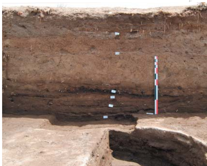
Fig. 6 - Vue générale de la coupe du secteur 1

3/ La stratigraphie s'achève par un bâti caractérisé par de larges murs ( fig. 7 ), probablement Ancien Empire, en partie détruits lors du creusement d'une excavation livrant quantité de rejets céramiques (romain tardif ?).