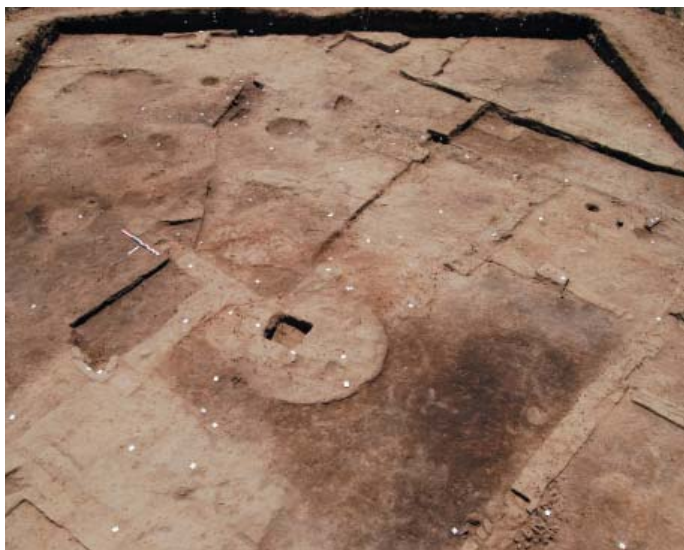
Fig. 8 - Vue générale du secteur 2 en fin de fouille 2008