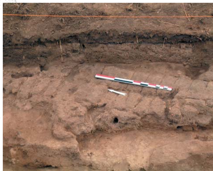
Fig. 7 - Murs de la phase la plus récente du secteur 1

Complémentaires au secteur 1 qui offre une vision verticale stratigraphique, les fouilles sur le secteur 2 se déroulent horizontalement, visant à une analyse de la gestion de l'espace domestique ( fig. 8 ). Ici, 255 m 2 ont été ouverts, qui ont permis d'identifier quatre niveaux successifs d'occupation. Les plus anciens n'ayant pas été atteints, nous commencerons par les plus tardifs, c'est-à-dire du haut en bas, dans le sens inverse de la chronologie. Sous la surface, on trouve un niveau Hyksos, représenté par trois tombes très arasées. L'état 2 est représenté par une série de murs en briques crues dont le développement général occupe l'ensemble de la surface ouverte. Les sols d'occupation relatifs à ces élévations sont résiduels et leur développement spatial n'a pu être que peu observé. Plusieurs structures, dont un dispositif de cuisson en fosse, sont liées à cet état dont la chronologie reste à préciser. On atteint enfin les phases finales de l'occupation prédynastique (Nagada IIIC-D) sous la forme d'un bâti structuré, en bon état de conservation, ce qui laisse augurer de possibilités d'études détaillées.